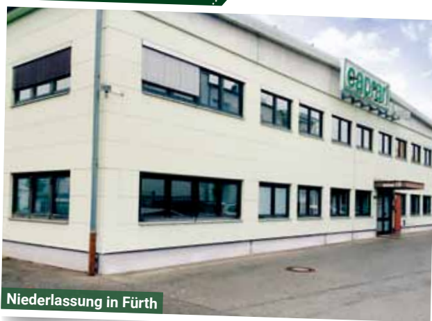
Niederlassung in Fürth

Caprari Pumpen GmbH sagt DANKE FÜR IHRE KUNDENTREUE