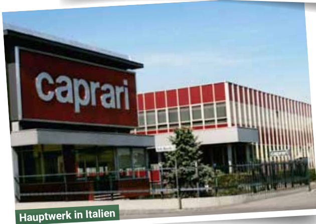
Hauptwerk in Italien